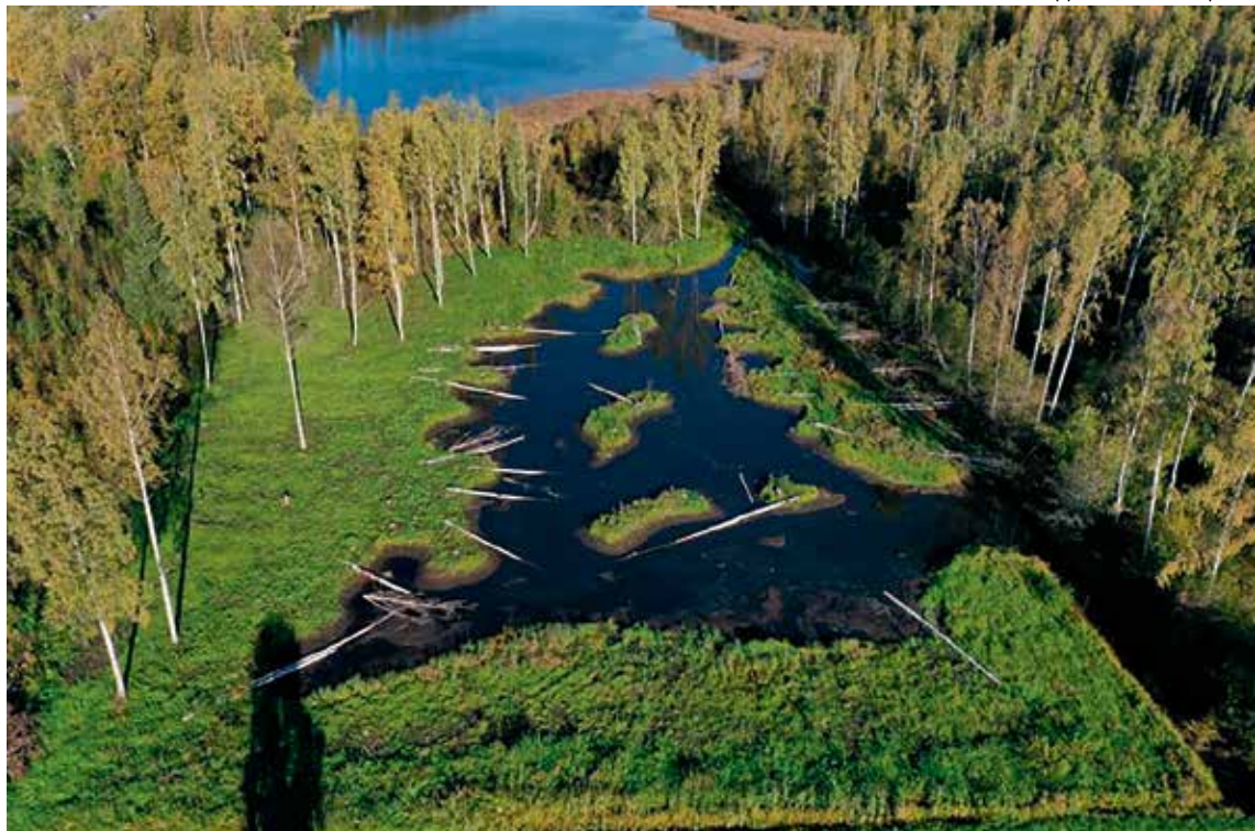
Viime vuosina tehdyt kosteikot mahdollistavat järvien vedenlaadun paranemista.

— Ilmaston muutosten vaikutukset yllättävät meidät. Ilmatieteidenlaitoksen mukaan ilman ilmastonmuutosta ennätyspitkää