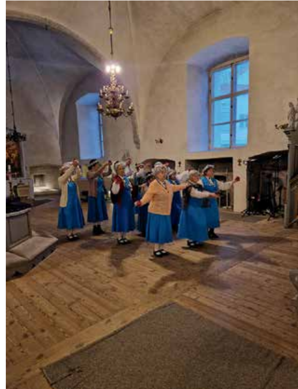
Inkerinsuomalaisten tanssiryhmä Kataja esittää tanssin jumalanpalveluksessa Pyhän Mikaelin kirkossa.