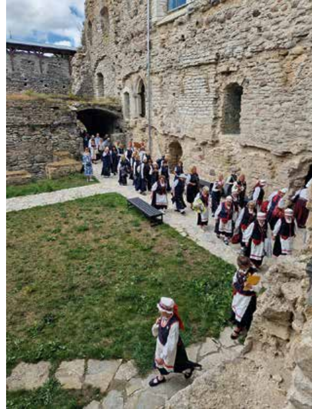
Kulkue saapuu inkeriläisten juhla jumalanpalvelukseen Padisen luostarin kirkkoon.