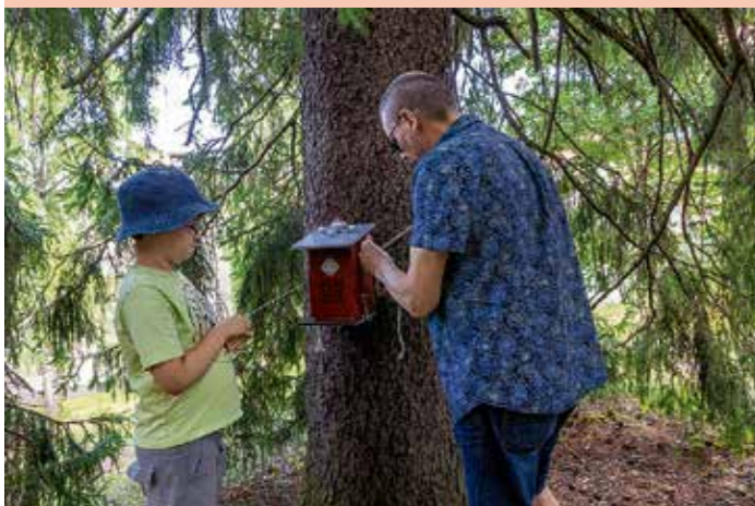
Lappeenrannan kirkon geokätkön piilotus.