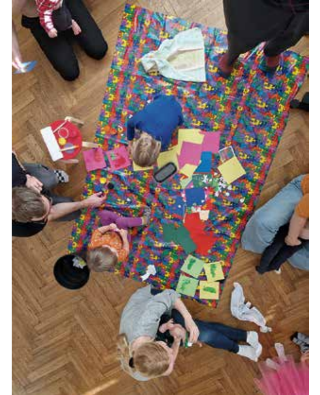
Isänpäiväkorttien askartelua suomalaisella seurakuntakodilla.