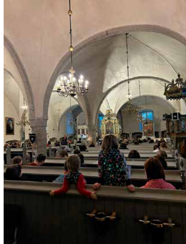
Kauneimmat Joululaulut Pyhän Mikaelin kirkossa.