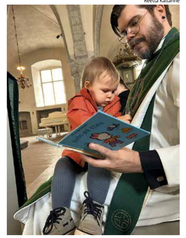
Lepohetki messussa Pyhän Mikaelin kirkossa.