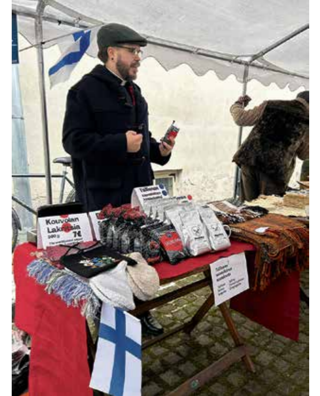
Suomalainen seurakunta joulumarkkinoilla.