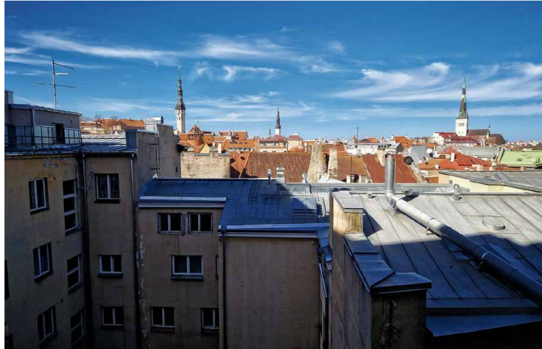
Näkymä suomalaisen seurakuntakodin ikkunasta Tallinnan Vanhaankaupunkiin.

Yksi suomalaisien seurakuntien erityispiirre Virossa on, että monet alueelliset seurakuntalaiset ovat juuriltaan inkerinsuomalaisia eli ny-