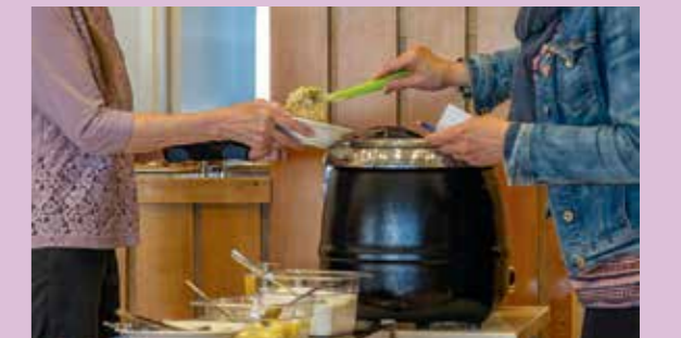
Kaikkissa Lappeenrannan seurakunnissa järjestetään jatkossa yhteisöruokailuja.