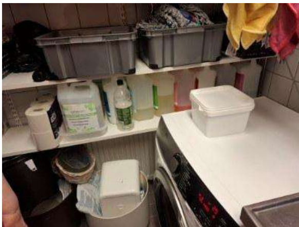
Siivouskomero siististi järjestyksessä