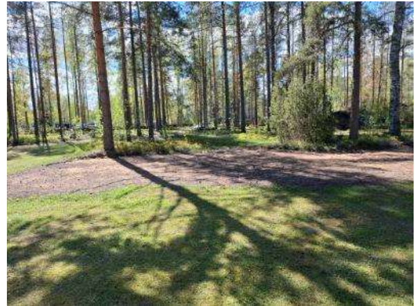
Perhosketo vähän kylvön jälkeen