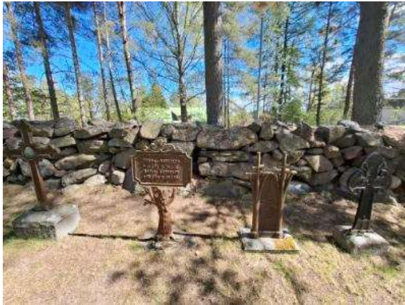
8.14 Poistettuja muistomerkkejä