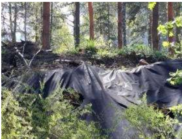
Hautahiekkakummut eri valmistumisvaiheissa