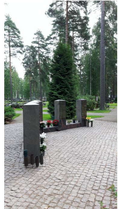
Ristikankaan hautausmaa.

Urnapuistoon ja muistolehtoon hautauksen hoitaa seurakunta, omaisille ei muodostu hautapaikkaan hautaoikeutta. Urnapuistossa on kaikilla yhteinen muistokivi, johon omaiset voivat halutessaan tilata nimilaatan. Muistolehtoon ei jää mitään näkyvää tietoa vainajasta. Ylämaan muistolehtoon haudatuille voivat omaiset halutessaan tilata nimilaatan.