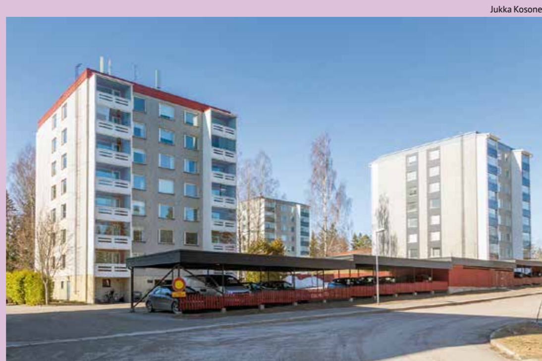
Saarenkatu 3-5 kerrostalot siirtyivät Lappeenrannan seurakuntayhtymältä Horisontti Group Oy:lle 28.2.2024.