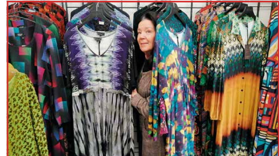
Persoonallinen Pikku Puffiikki

Pääsiäisen mukulamessu klo 16 Sammonlahden kirkossa, Hietakallionk. 7. Soppararjoilu.