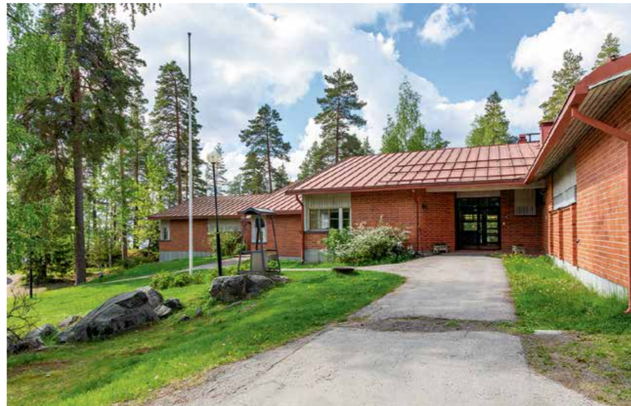
Piiluvan leirikeskus sijaitsee Pien-Saimaan rannalla, noin seitsemän kilometrin päässä Lappeenrannan keskustasta.

Sinetti uuden leirikeskusten suunnittelusta saadaan kevään aikana Virallisesti asiasta ei ole vielä päätetty, mutta yhteinen kirkkovaltuusto päätti kokouksessaan